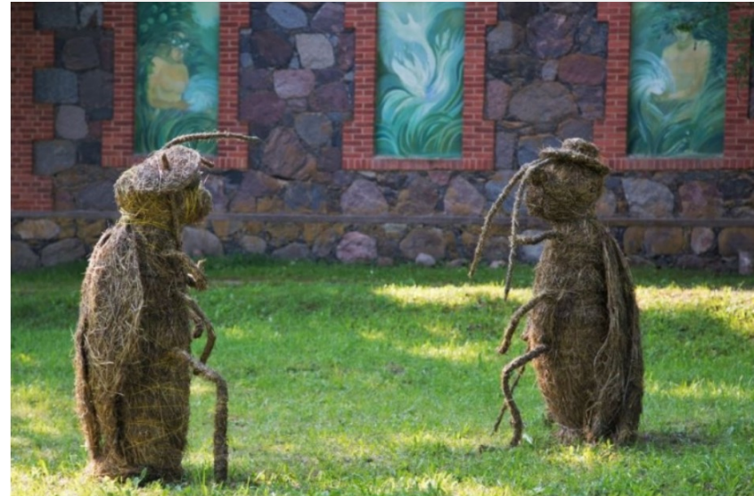
Kopiena zīmē un nozīmē_LLF